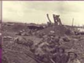
Dans le camp, les tranchées sont creusées et des abris aménagés pour protéger les troupes.