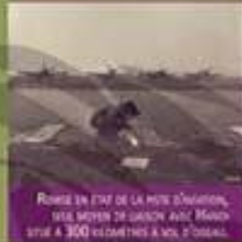
Remise en état de la piste d'aviation, via moyen de chariot avec hélicoptère à 300 kilomètres à vol d'oiseau.