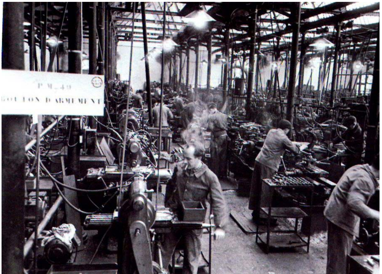
Vue d'un atelier de la Manufacture d'Armes de Tulle en 1949 - Fabrication du Pm MAT 49

Au début de l'année 1952, il se fabrique 4 600 armes par mois à Tulle. En 1953, la Manufacture a construit 63 000 PM, 52 000 en 1954, 60 000 en 1955 et 85 000 en 1956. Le PM MAT 49 permet d'oublier les épreuves traversées à la fin de la guerre, l'établissement crée de nombreux emplois, la ville de Tulle est redynamisée économiquement.