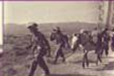
Assaut des troupes vietminh sur le La-Cao dans la vallée de Diên Biên Phu, sur un pont de bois, lors de l'opération « Castor ».